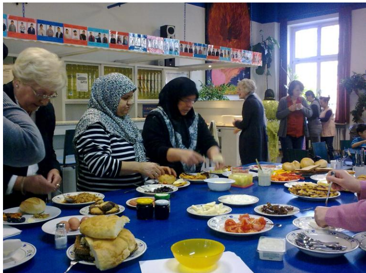
Frauenfrühstück/Remagen, oben: Musikgruppe