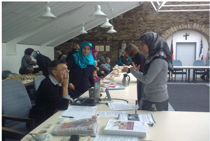
Präventionsveranstaltung mit der Suchtberatungsstelle

Begleitet wurden Kurse in Mayen und im Landkreis Ahrweiler. In Mayen fanden außerdem Präventionsveranstaltungen in Kooperation mit der Psychosozialen Behandlungsstelle für Suchtkranke /Interkulturelle Suchthilfe statt.